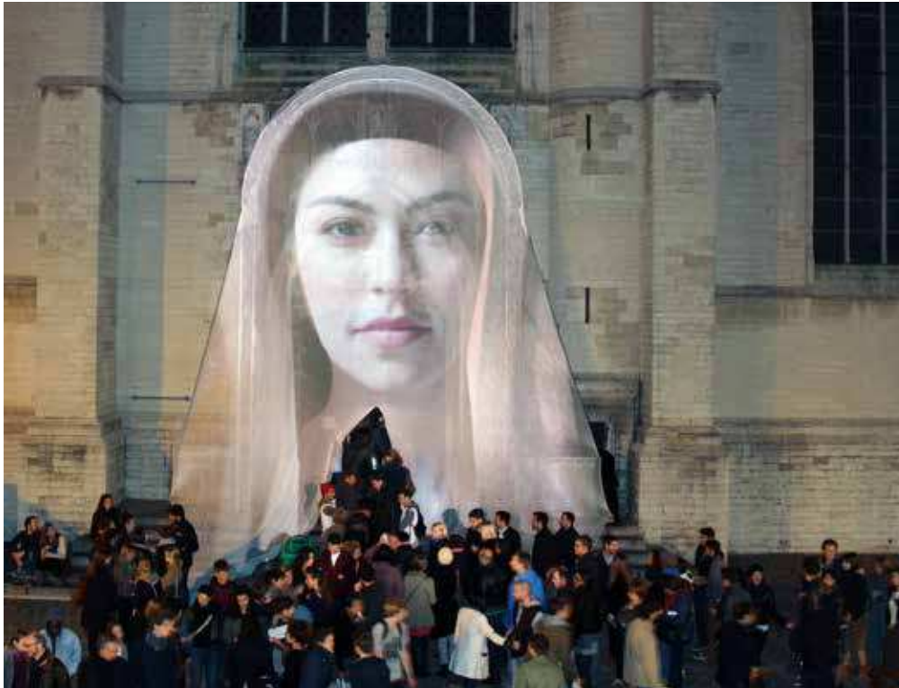
AWAKENING OF MARY