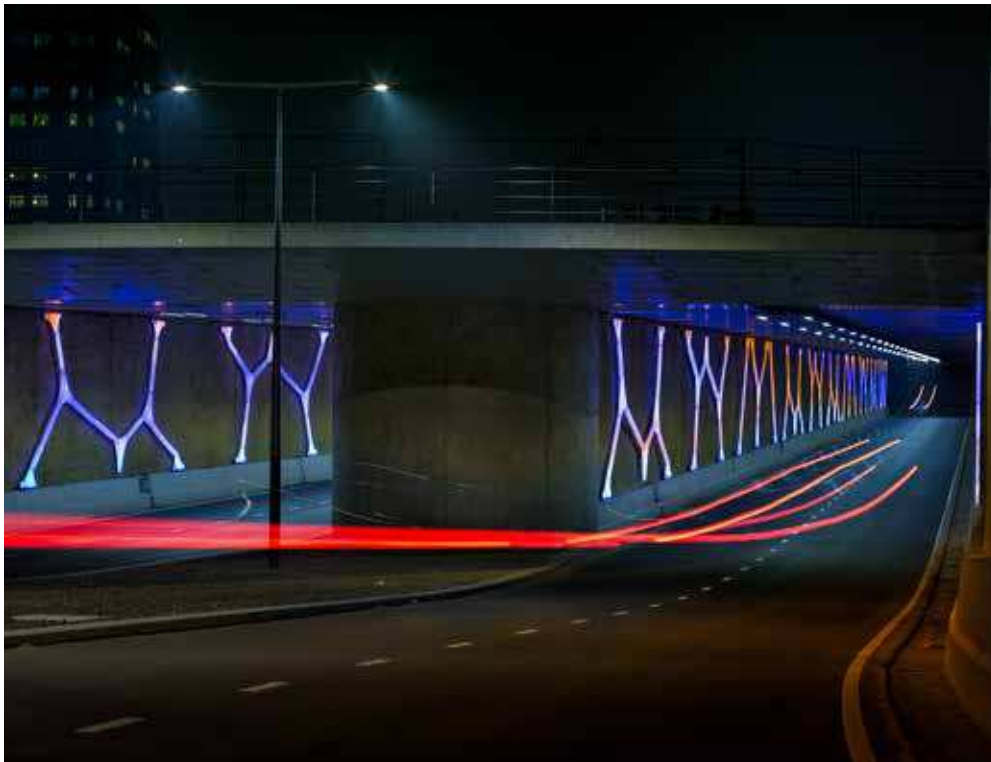
DOLMEN LIGHT TUNNEL

Ook Juicy Lights is een beweeglijke lichtsculptuur die contact zoekt met de wandelaar in de straat. Boven de straat hangende druiventrossen lekken druppels licht op de mensen die er onderdoor lopen. De passanten zetten de sculpturale lichtbronnen in beweging. Niet alleen verandert de lichtkleur binnen de druiventrossen, waarmee ze op elkaar reageren, ook projecteren de hangende sculpturen licht op de straat. Daarmee refereert Ex aan het rijpen van de druiven, het zonlicht dat door de vruchten wordt opgenomen, waardoor ze sappiger en zoeter worden.