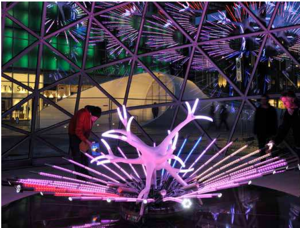
FLOWER FROM THE UNIVERSE

Regia, de grootste waterleliesoort die slechts twee nachten per jaar bloeit. Ex is ook bij dit kunstwerk uitgegaan van de genius loci: de bloem die haar bezoekers moet verleiden – zonder deze samenwerking is geen voortplanting mogelijk. In dit kunstwerk laat zij nadrukkelijk een interactieve relatie ontstaan tussen bloem en bezoeker. De bezoeker stuurt, al dan niet bewust, de bloem aan met bewegingen en de kleuren van zijn kleding. Een zenuwcel, waarin een speciaal ontworpen sensor voor de kleur- en bewegingsherkenning is verborgen, vormt het hart van de bloem. Zo ontstond in hartje Amsterdam, in een van de oudste botanische tuinen ter wereld, tussen de bezoeker en Bloem van het Universum een dynamische en onvoorspelbare uitwisseling.